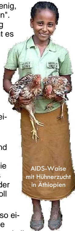
AIDS-Waise mit Hühnerzucht in Äthiopien

In vielen Ländern erhalten Frauen so einen neuen rechtlichen Status; diese Gruppen sind daher wichtiger Bestandteil aller ganzheitlichen Projekte von Helping Hands.