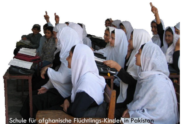
Schule für afghanische Flüchtlings-Kinder in Pakistan

In politischen Krisengebieten bemüht sich Helping Hands außerdem um Friedensförderung und Konfliktbewältigung, wie z.B. in Sri Lanka.