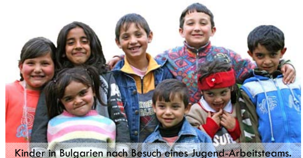
Kinder in Bulgarien nach Besuch eines Jugend-Arbeitsteams.