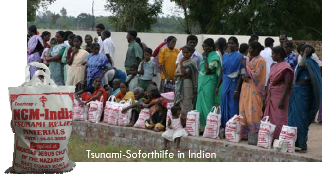
Tsunami-Soforthilfe in Indien