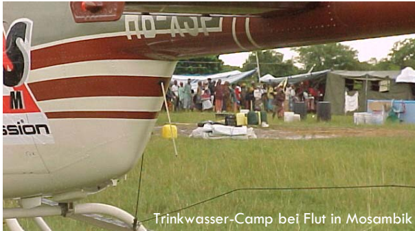
Trinkwasser-Camp bei Flut in Mosambik