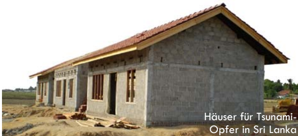
Häuser für Tsunami-Opfer in Sri Lanka

Seit seiner Gründung hat Helping Hands in vielen Notlagen helfende Hände gereicht, u.a. bei Flutkatastrophen, Erdbeben, Flüchtlingswellen und dem Tsunami. Dabei spezialisieren sich Helping Hands und seine Partner bei der Soforthilfe auf Trauma-Seelsorge und logistische Hilfe vor Ort. Örtliche Mitarbeiter sind speziell für diese Dienste ausgebildet. Sie sind Hunderttausenden in vielen Ländern mit Lebensmitteln, Notunterkünften, Haushaltspaketen, Hygieneartikeln, Medikamenten und medizinischen Helpsteams beigestanden.